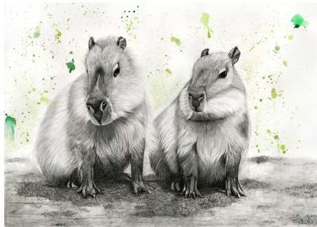
Bild 3: Don't Worry, Be Capy! Graphit und Aquarellfarbe auf Papier (250 g/m 2 ), 59,4 cm x 40 cm.