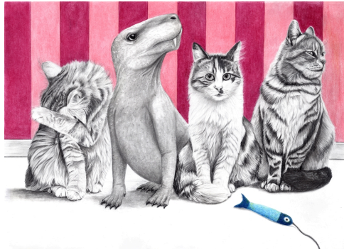
Bild 1: Finding Your Niche, Graphit und Farbstift auf Papier (250 g/m 2 ), 59,4 cm x 40 cm.